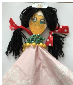
lalka z drewnianej łyżki