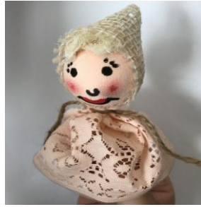
lalka z piłeczki pingpongowej